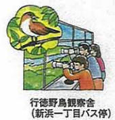
行徳野鳥観察会 (新浜一丁目バス停)