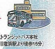
京成トランジットバス本社 (市川塩浜駅より徒歩15分)