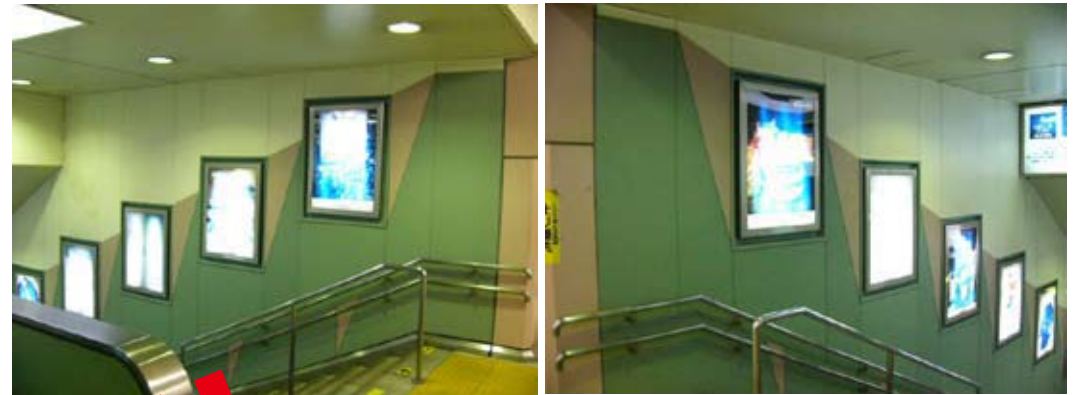
※見え寸法 H1,010×W710 板寸法(ポスター寸法) H1,080×W770